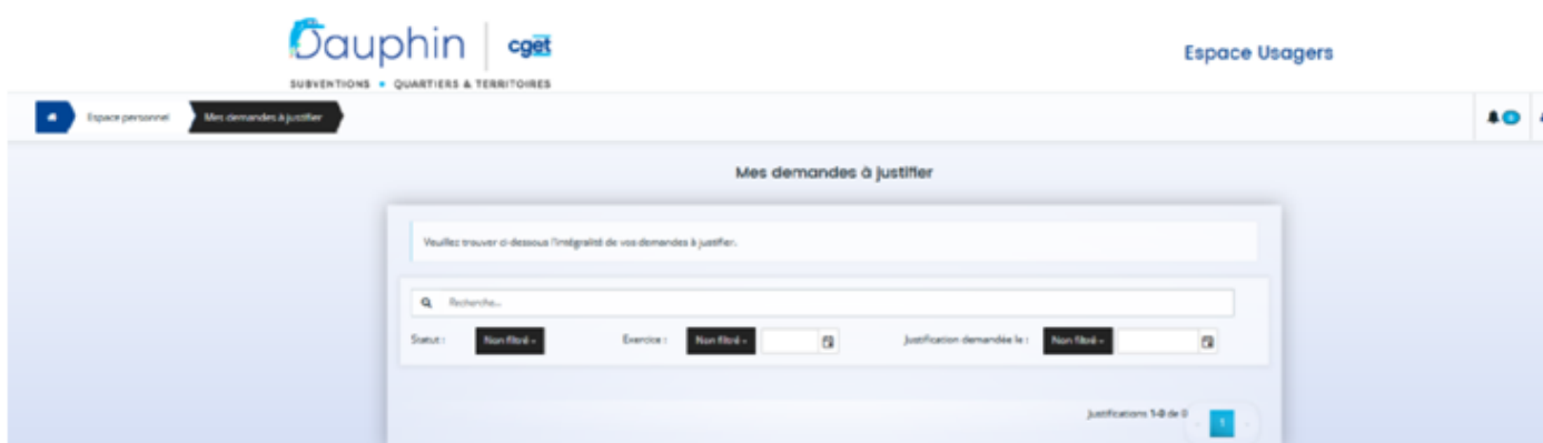
Figure 2 : interface des demandes à justifier

Avec l'interface proposée ci-dessous, vous pouvez, filtrer les subventions à justifier sur le nom de la demande, son statut (en instruction, mise en paiement, payée, etc.) ou l'exercice budgétaire.